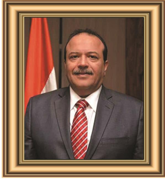
السيد الاستاذ الدكتور مجدى سبع رئيس الجامعة