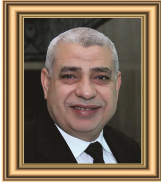
السيد الاستاذ الدكتور محمد حسين محمود نائب رئيس الجامعة لشئون التعليم والطلاب